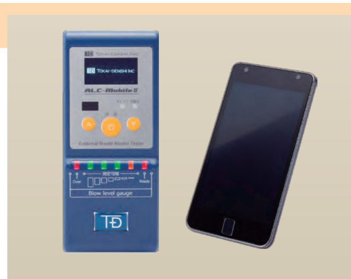
• 携帯電話の対応機種は当社ホームページでご確認ください

Bluetooth 接続でスマートフォン (Android) との連動が可能です。測定専用の Android アプリによって、顔写真付きのデータを送信することができます。音声ガイドや日本語表示で、操作がより分かりやすくなりました。また、圏外での測定や、携帯電話の電池切れ時でも、測定器本体に日時付き測定結果を保存しますので、後で確認する事が可能です。