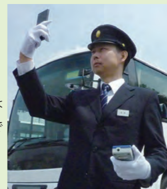
• 携帯電話の対応機種は当社ホームページでご確認ください

各営業所の測定、点呼の結果は クラウド型動画点呼システムで 点呼動画データはいつでも確認可能!